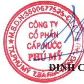
ĐINH CHÍ ĐỨC